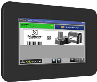
MPERIA 7" D